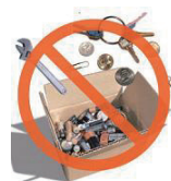
切忌多个电池与其他物品混放